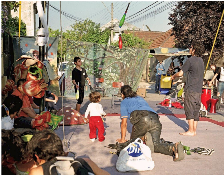
(Arte en la calle)

A continuación se mostrarán fotografías de diferentes formas de ocio: